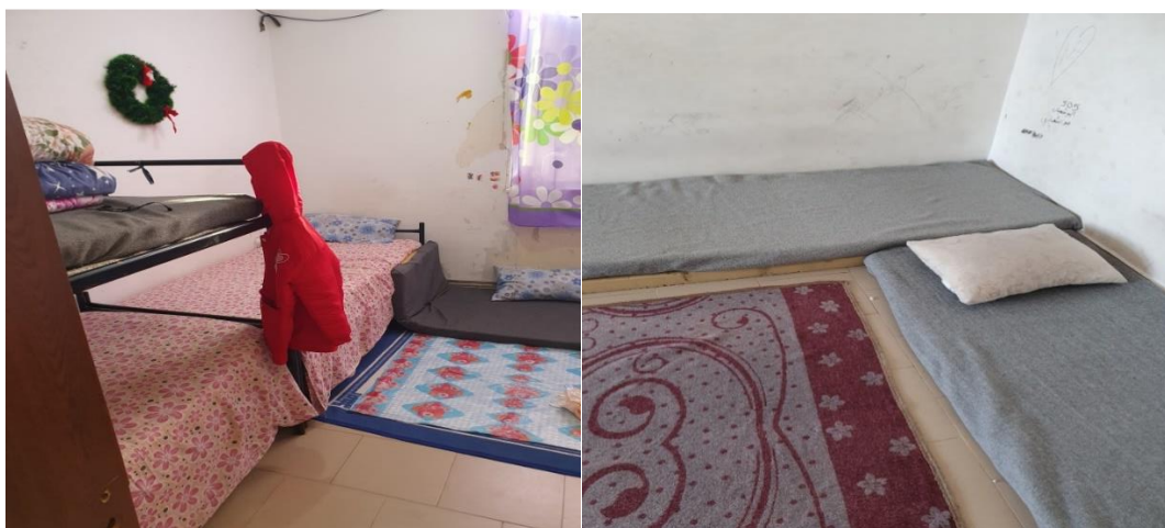
Спални помещения със свалени матраци на пода

Проверяващият екип на омбудсмана констатира на място, че в някои спални помещения няма легла, а само поставени матраци на пода. На въпрос защо това е така, персоналет отговори, че настанените чужденци предпочитали да спят на земята и дори при наличието на легла, те не ги ползват, а смъкват дюшеците на пода и спят там.