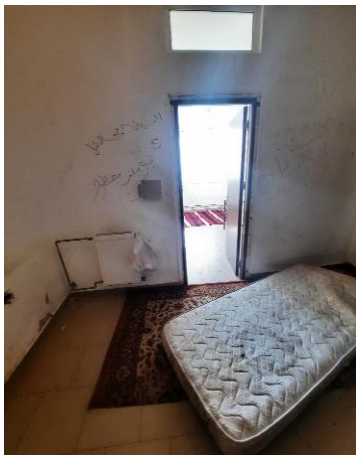
Струпани стари матраци на пода и по леглата в неизползваеми стаи