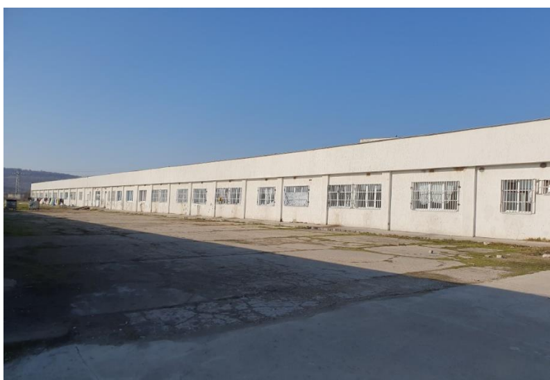
Девето хале на РПЦ-Харманли

Девето хале се помещава в едноетажна сграда, в която почти всички стаи се ползват за настаняване на лица търсещи закрила. На всички прозорци има поставени решетки.