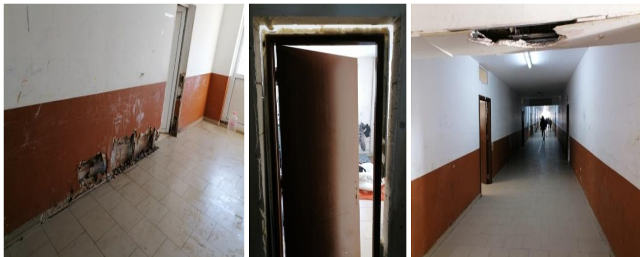
При санитарното помещение за жени

Коридорът на сградата и много от стаите, в които са настанени лица, търсеци закрила, имат нужда от ремонтни дейности.