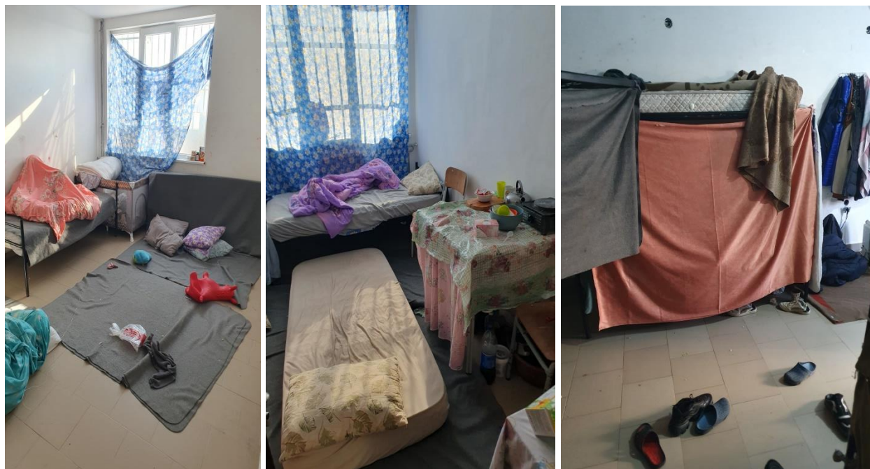
Спални помещения с настанени лица в Девето хале на РПЦ-Харманли

Размерът на нанесените щети е голям и няма фактическа и финансова възможност за пълното им и бързо възстановяване. Директорът на центъра сподели, че към момента за извършването на ремонтни дейности разчитат основно на ограничени бюджетни средства и дарения от НПО и граждани. Последно в центъра са получили дарение под формата на постелъчен инвентар и нови матраци от Върховния комисариат за бежанците към ООН и те са раздадени на новонастанените семейства с деца и на непридружените малолетни и непълнолетни.