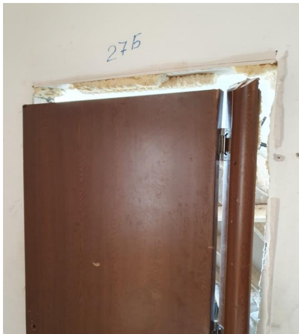
Ползваната за склад в Девето хале стая 27Б, с паднала каса, поради липса на крепежни елементи

Бяха установени изкъртени каси на врати (поради липса на крепежни елементи, освен монтажна пяна), пробити стени в коридора и по стаите, счупени плочки и санитарен фаянс в общите бани. Беше изказано становище, че причината за извършените некачествено ремонтни дейности са във връзка с проведени процедури по обществени поръчки, с водещ критерий – „най-ниска цена“. Проектната документация се изготвя без предварително съгласуване със служителите от РПЦ – Харманли, а в комисиите по обществени поръчки не са включени като членове експерти от обекта, запознати най-добре със ситуацията на място