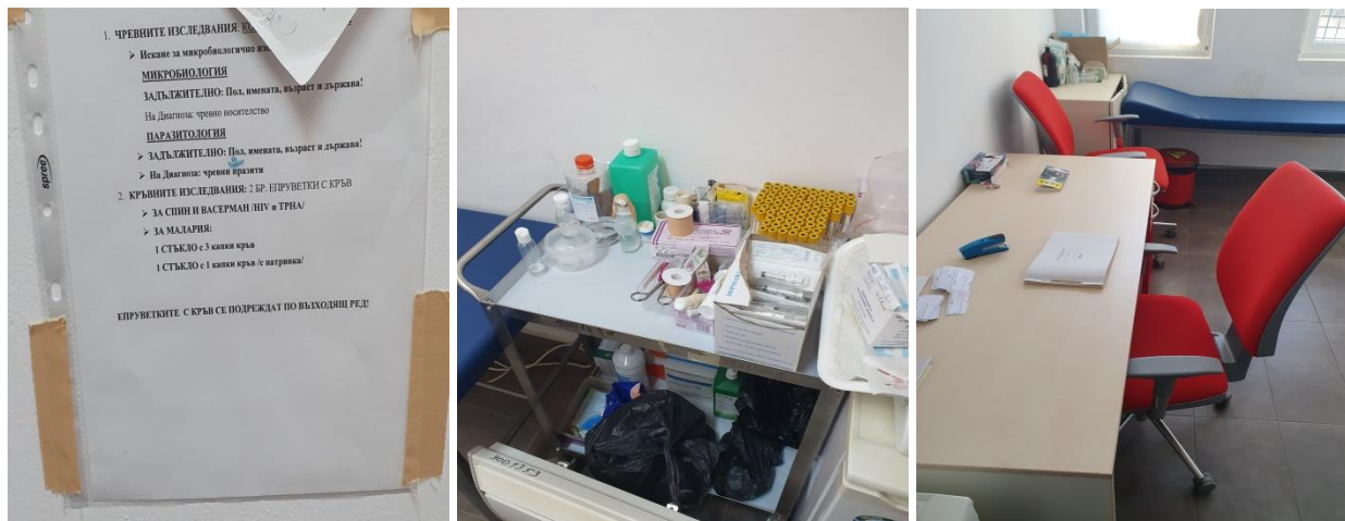
Здравен кабинет в административната сграда на РПЦ - Харманли

В здравния кабинет се осигуряват и ваксинации против КОВИД-19 на всички желаещи от РЗИ. Към момента на извършваната проверка в РПЦ - Харманли нямаше случаи на болни от КОВИД-19. Извършва се и масова имунизация против дифтерия. Изготвени са диети и е осигурено диетично хранене за нуждаещите се бежанци – основно при диабет и стомашни заболявания.